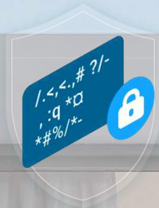
Crittografia AES a 128 bit

La protezione dei dati e della privacy è la nostra priorità. Il trasferimento dei dati tra la telecamera ed EZVIZ Cloud è interamente crittografato. Solo l'utente ha i codici per decrittografare i propri dati.